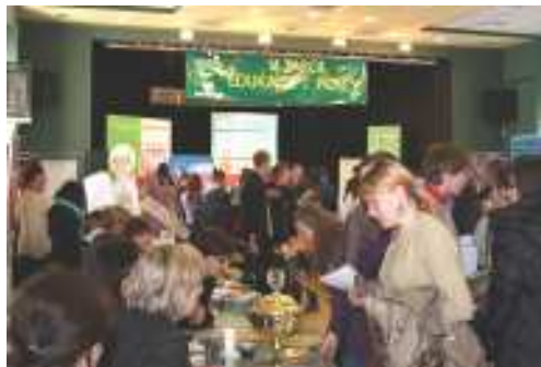
Targi w Mosinie przyciągnęły tłumy gości

W konkursie zorganizowanym przez Gminne Centrum Informacji można było wygrać wiele atrakcyjnych nagród. Szczególnie zadowoleni mogą być uczniowie Gimnazjum w Rogalinie, którzy wylosowali wycieczkę do Bazy Lotnictwa Taktycznego w podpoznańskich Krzesinach. Gimnazjaliści będą mogli podziwiać samoloty F-16 i zapoznać się z co-