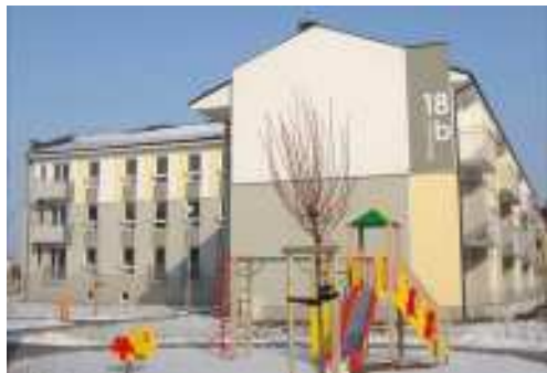
Obok nowych budynków powstał plac zabaw dla najmłodszych mieszkańców

Marlena Chmielewska Urząd Miejski w Mosinie