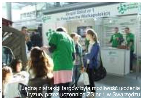
Jedną z atrakcji targów była możliwość ułożenia fryzury przez uczennice ZS nr 1 w Swarzędzu