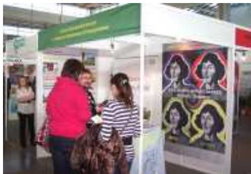
Młodzież miała okazję do rozmowy z nauczycielami i uczniami szkół

Targi Edukacyjne są dla młodzieży doskonałą okazją do określenia dalszej ścieżki edukacji. Szkoły prowadzone przez Powiat Poznański oferują swoim uczniom wysoki poziom kształcenia, możliwość zdobycia zawodów powiązanych z wymaganiami rynku pracy, bogato wyposażoną bazę dydaktyczną, świetną infrastrukturę sportową, wymianę młodzieży z partnerskimi szkołami w kraju i za granicą oraz dodatkowe zajęcia pozalekcyjne. Uczniowie szkół zawodowych odbywają praktyki m.in.