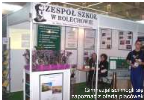
Gimnazjaliści mogli się zapoznać z ofertą placówek