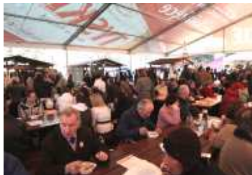
„Józefinkom” towarzyszyły degustacje regionalnych przysmaków

„Józefinki” to także moc atrakcji dla całych rodzin. W specjalnie przygotowanej Osadzie Rycerskiej dzieci mogły przymierzać zbroje, dorośli natomiast chętnie nabywali kutą przez jednego z rycerzy okolicznościową „Józefinkową” monetę. W ramach II Swarzędzkich Spotkań Józefów przybyła do Swarzędza grupa 60 osób noszących imię patrona miasta. Spotkanie uczczono wspólnym zdjęciem oraz degustacją „Józefowego Placka”. To pyszne, miodowe ciasto, autorstwa Cukierni Hoffmann z Kobylnicy, wygrało miesiąc wcześniej gminny konkurs na oryginalny lokalny specjał. „Józefowy Placek” jest tak smakowity, że ma szanse dorównać popularnością rogalom marcińskim i papieskim kremówkom. Dużym powodzeniem cieszyła się