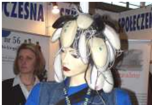
Uczniowie prześcigali się w pomysłach na przyciągnięcie uwagi zwiedzających

Targi Edukacyjne są dla młodzieży doskonałą okazją do określenia dalszej ścieżki edukacji. Szkoły prowadzone przez Powiat Poznański oferują swoim uczniom wysoki poziom kształcenia, możliwość zdobycia zawodów powiązanych z wymaganiami rynku pracy, bogato wyposażoną bazę dydaktyczną, świetną infrastrukturę sportową, wymianę młodzieży z partnerskimi szkołami w kraju i za granicą oraz dodatkowe zajęcia pozalekcyjne. Uczniowie szkół zawodowych odbywają praktyki m.in.